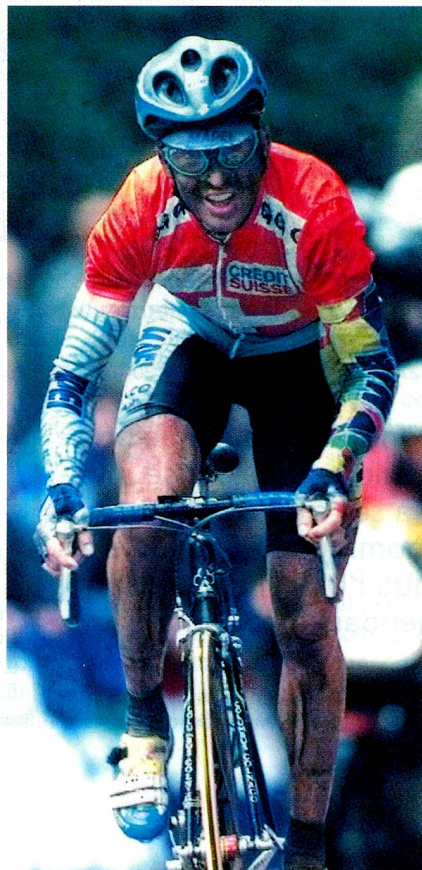
Oscar Camenzind en route pour son titre de champion du monde cycliste sur route.

Cette victoire ne fait toutefois pas oublier les affaires de dopage qui ont éclaté cette année au Tour de France. Trois coureurs suisses, Laurent Dufaux, Armin Meier et Alex Zülle, ont avoué s'être injecté régulièrement de l'EPO, une substance interdite. Ils ont été suspendus pour sept mois par l'Union cycliste internationale. ■