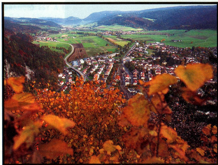
Vue du Val-de-Travers avec au premier plan Fleurier.