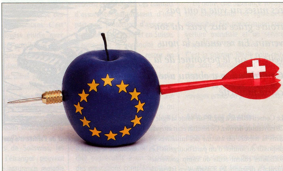
Les éléments mythologiques vont jouer un rôle une fois de plus dans la campagne concernant l'initiative «oui à l'Europe».

Pour replacer cette initiative populaire dans son contexte, il convient de rappeler les moments-clés de la politique européenne de la Suisse. Mai 1992: le Conseil fédéral demande l'ouverture de négociations en vue de l'adhésion à l'Union européenne; 6 décembre 1992: le souverain rejette en votation fédérale la participation de la Suisse à l'Espace économique européen; le Conseil fédéral «gèle» alors la demande d'adhésion, mais fait de la participation pleine et entière de la Suisse à l'Union européenne son «objectif stratégique» de politique européenne et il demande à Bruxelles de pouvoir négocier sur une extension des accords de libre-