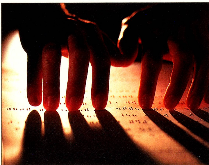
Un des projets de l'Expo a été conçu par des aveugles pour des voyants.

L'exposition, présentée sur un plan d'eau de 1000 mètres carrés, sera consacrée aux mille histoires de vie rattachant à ces paysages aquatiques, invoquant des thèmes →