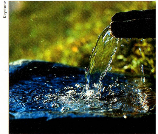
Les cantons de Suisse orientale ont mis en scène le thème de l'eau.