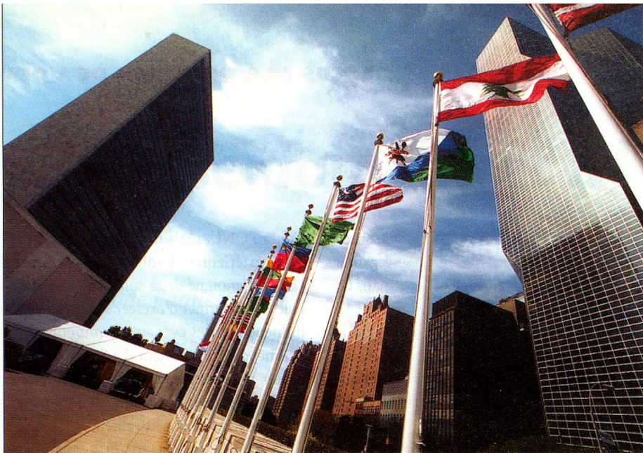
La Suisse et le Vatican absents: drapeaux des nations devant le siège principal des Nations Unies à New York.

exemples historiques qui le démontrent sont légion. N'est-ce pas sous l'influence de l'armée napoléonienne que l'ancienne Helvétie fait pour la première fois l'expérience du principe de la démocratie parlementaire et d'un embryon d'unité nationale? Durant la Première Guerre mondiale, les Romands ont pris le parti de l'Entente tandis que les Alémaniques prennent le parti des puissances de l'Axe – ce qui démontre la relativité des frontières politiques face aux affinités linguistiques.