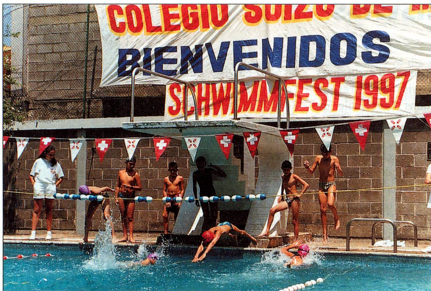
Le sport à l'honneur: l'école suisse à Mexico

«Vous pensez que les Suisses de l'étranger doivent être mieux considérés par le gouvernement et le parlement suisses? Participez aux votations et élections, c'est le meilleur moyen de vous faire entendre!»