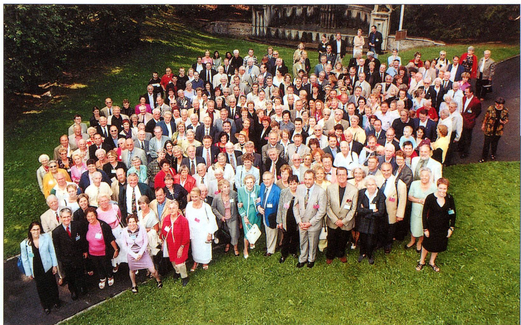
Joyeux congressistes à Davos.