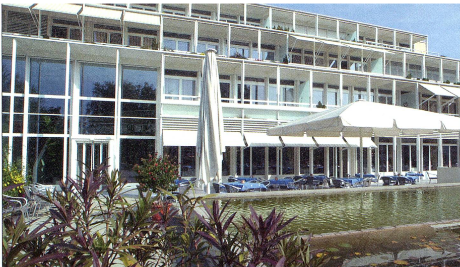
La Résidence du Parc à Meilen.