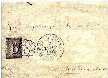
Première suisse: la première lettre connue en Suisse à avoir été affranchie au moyen d'un timbre, datée du 2 avril 1843.