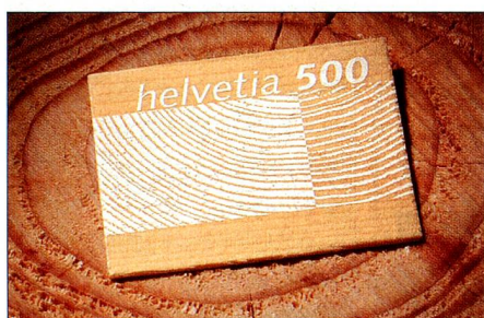
En bois: l'accent a été mis sur la matière première durable et polyvalente lors de la réalisation et de la conception du timbre, soulignant ainsi non seulement le caractère unique de ce timbre mais aussi l'esprit novateur de la Poste.