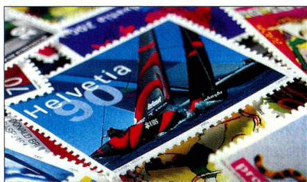
Mondialement connu: le timbre-poste spécial «Alinghi, Switzerland» a connu un succès retentissant. Les feuilles miniatures étaient déjà épuisées peu de temps à peine après l'émission du timbre.