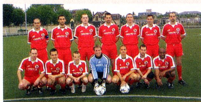
L'équipe «fanion» de l'US suisse de Paris