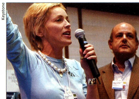
Sharon Stone au WEF

19 janvier. Après une année 2004 où elle a transporté 1,5 million de passagers en moins, la compagnie Swiss va supprimer près de 1000 emplois parmi les 8100 actuels et réduire sa flotte régionale de 13 avions. Depuis la déconfiture de Swissair, la société avait déjà rayé à peu près un tiers de son personnel et réduit sa flotte de moitié. Annoncée par le magazine «Bilan» le 9 février, la reprise de Swiss par la compagnie allemande Lufthansa a été officialisée le 22 mars: les conseils d'administration des deux groupes et les principaux actionnaires, dont la Confédération, ont donné leur feu vert.