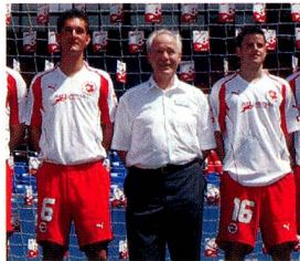
Köbi Kuhn, entraîneur national