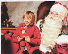
Magie de Noël pour petits et grands

Un feu crépite dans l'âtre d'une maisonnette en bois. Une mélodie séculaire réveille des souvenirs scintillants. Des cœurs s'adoucissent le temps de l'Avent. Les yeux des enfants brillent lorsqu'ils écoutent les contes de fées. Au fil du mois de décembre, période de gourmandise où l'on fait bonne chair, les marchés de Noël réanniment les saveurs d'autan. Par ci, on confec-