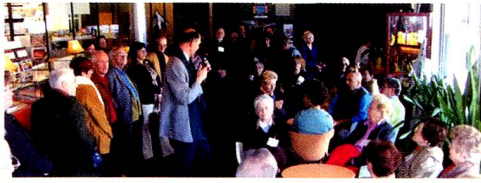
Visite du musée d'Agropolis le 18 mars dernier

Lors de notre Assemblée générale ordinaire du 18 mars, à laquelle une bonne centaine de personnes ont participé, le programme suivant a été adopté : Dimanche 20 mai, réunion de printemps. Mercredi 1 er août, fête nationale. Dimanche 4 novembre, journée en péniche.