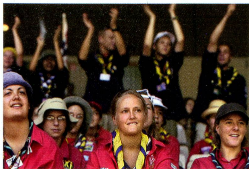
Le scoutisme suisse fête ses 100 ans.

Réuni à Davos autour du thème «l'évolution dans l'équilibre des forces», le Forum économique mondial (WEF) s'est clôturé sur un terne appel à l'espoir et à la paix. Les deux grands débats sur le cycle de Doha (libéralisation des échanges commerciaux en faveur des pays pauvres) et le climat n'ont pas éclipsé la priorité majeure des grands patrons: la croissance économique. Quant au mouvement d'opposition, il semble