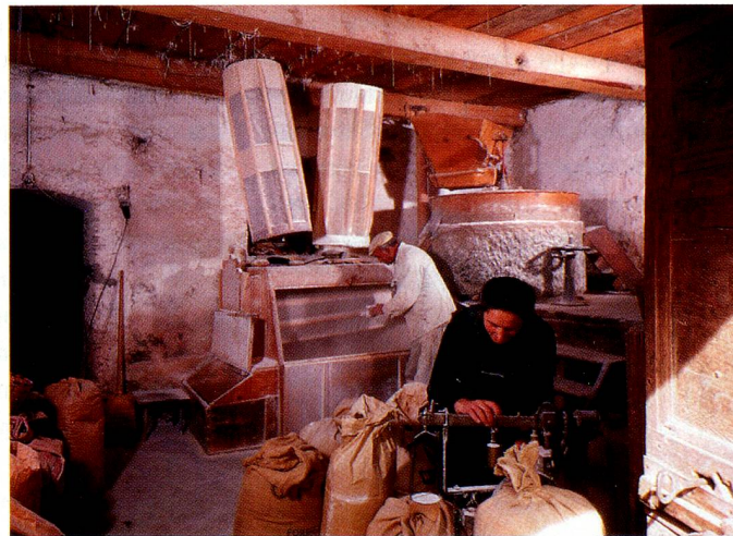
Moulin à grains à Poschiavo.