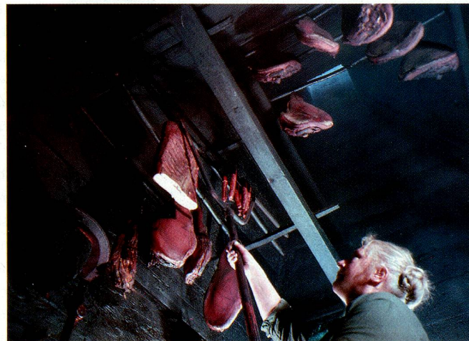
Fumoir dans le Val d'Illier.