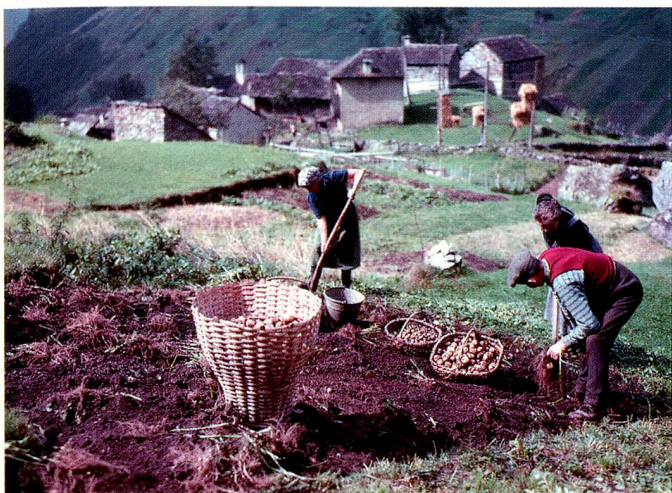
Ramassage de pommes de terre à Malvaglia.