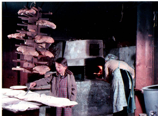
Cuisson du pain à Lugnez.