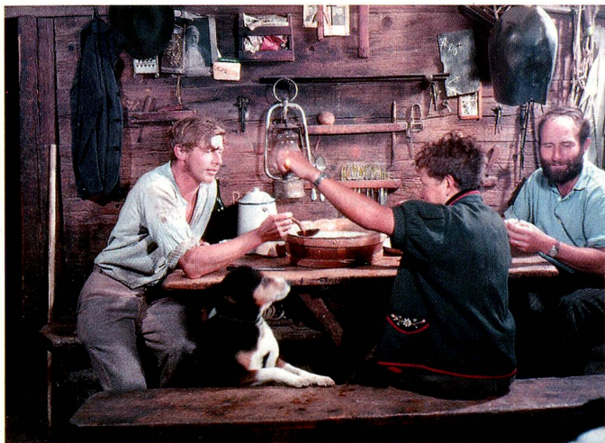
«Suifi», boisson à base de petit-lait, sur l'alpage de Gummen, à Nidwald.