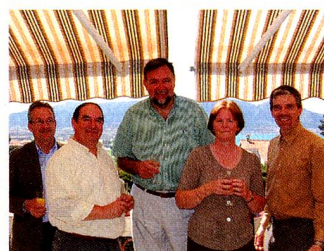
Quelques membres de la délégation de l'ASTER reçus par notre Consul général et son épouse à Marseille.