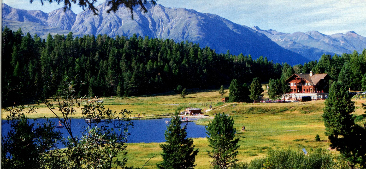
Hotel Lej da Staz, lac de Staz, St-Moritz