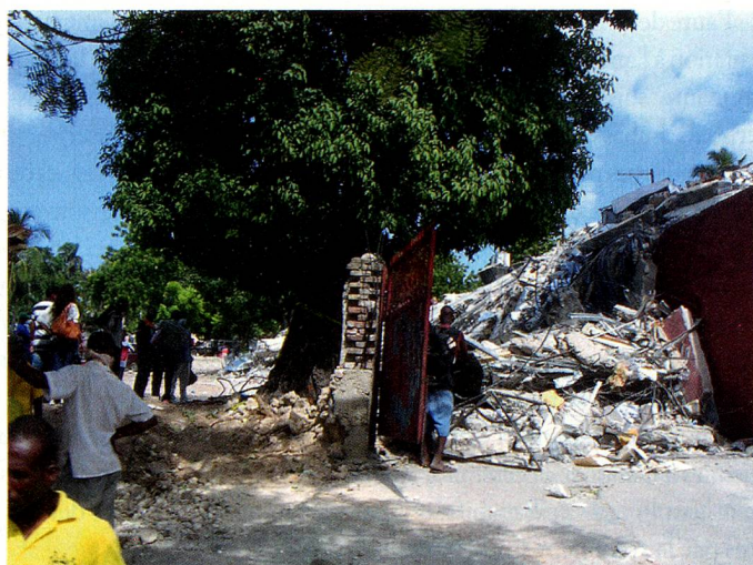
Suisses en difficultés en Haïti.

Pour renforcer les ambassades à Port-au-Prince et Saint-Domingue dans leurs tâches, Centre de gestion de crises du DFAE y a envoyé en tout huit membres du pool d'intervention de crise (PIC); les deux premiers membres du PIC sont arrivés quelques heures seulement après le tremblement de terre dans une région instable difficilement accessible. Le Centre de gestion de crises a immédiatement installé à la centrale le numéro de la hotline qui prenait, 24 heures sur 24, les appels de parents inquiets, enregistrait les avis de recherche et les «feed back» correspondants, les comparait et les transmettait en permanence pour traitement à notre représentation à Port-au-Prince.