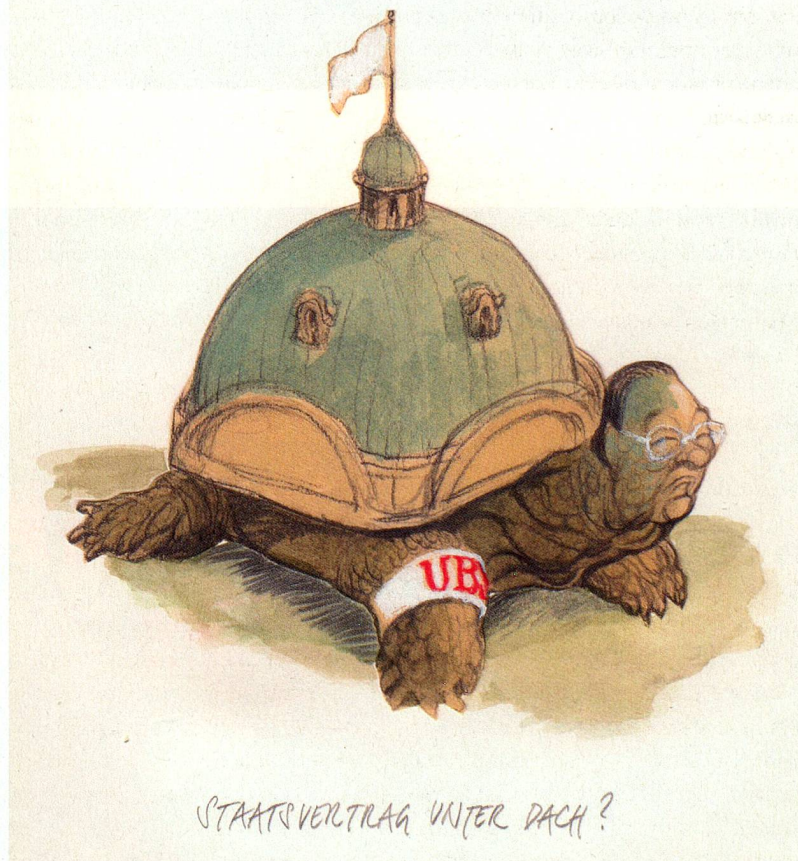
TRAITÉ SOUS TOIT?