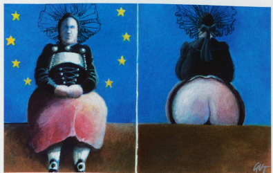
L'ouverture de la Suisse vers l'UE

DOCUMENTATION Thomas Cottier, Rachel Liechti-McKee (Hrsg.): Die Schweiz und Europa. Wirtschaftliche Integration und institutionelle Abstimmung. Vöf Hochschulverlag AG, Bern 2009. 358 S., CHF 58.–, EUR 39,90. www.vof.ethz.ch Dieter Freiburghaus: Königsweg oder Sackgasse? Sechzig Jahre schweizerische Europapolitik. Verlag Neue Zürcher Zeitung, Zürich 2009. 445 S., CHF 48.–, EUR 31.–. www.nzz-libro.ch Rapport de politique étrangère 2009, Rapport Europe 2006 (ces deux documents sont consultables à l'adresse www.bbl.admin.ch/dienstleistungen/index.html?lang=fr ) Centre de documentation www.doku.zug.ch