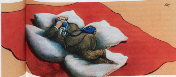
Les relations de la Suisse avec l'UE