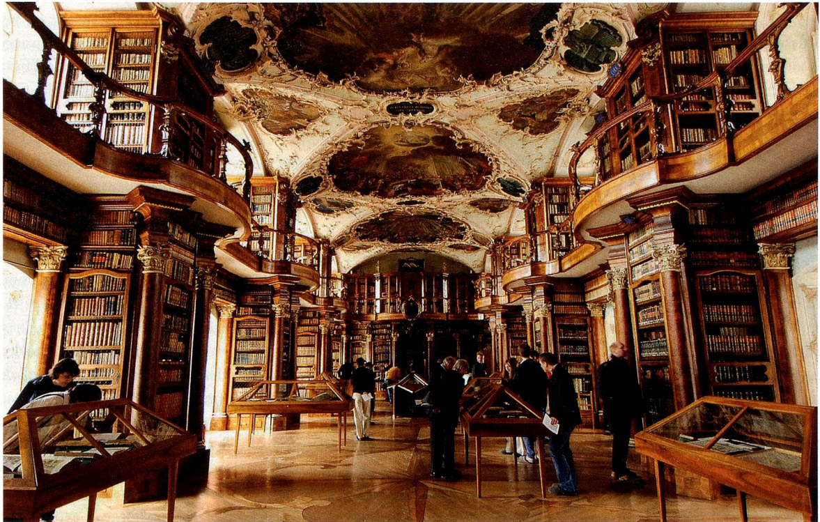
La célèbre Bibliothèque Abbatiale du couvent de Saint-Gall

88 e CONGRÈS DES SUISSES DE L'ÉTRANGER DU 20 AU 22 AOÛT 2010 À ST-GALL