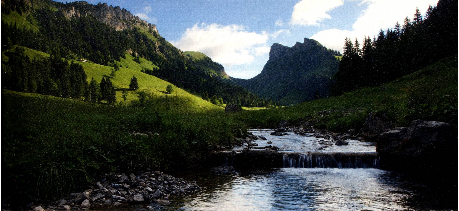
Justistal, parc naturel lac de Thoune-Hohgant, Oberland bernois