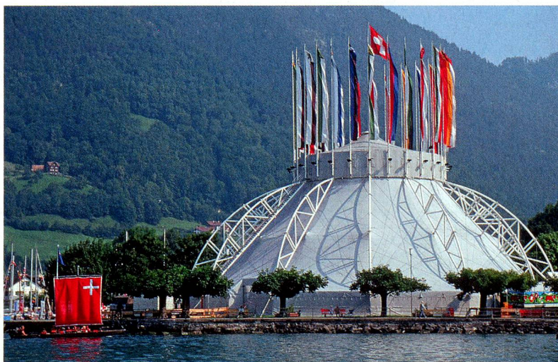
La Place des Suisses de l'étranger en 1991, avec la tente Botta dressée à l'occasion de la célébration des 700 ans de la Confédération

Le délai de remise des idées court jusqu'au 31 mars 2012. Les idées primées seront révélées au public en juillet/août à Brunnen et à l'occasion du Congrès des Suisses de l'étranger à Lausanne en août 2012.