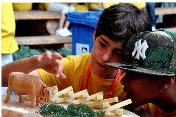
Joyeuse animation dans les camps d'été de la Fondation pour les enfants suisses à l'étranger

laire correspondant peut être demandé avec l'inscription.