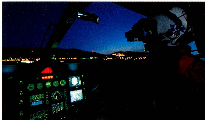
Dans le cockpit d'un hélicoptère pendant un vol de nuit