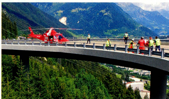
Intervention lors d'accidents de la circulation: la police fait souvent appel à la Rega

toutefois de l'offre du TCS. Car la concurrence laisse espérer une baisse des tarifs.