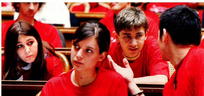
Jeunes dans la salle du Conseil national à Berne pendant la session des jeunes