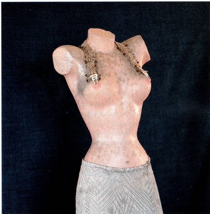
«Robe de soirée avec collier-bustier» (1968)