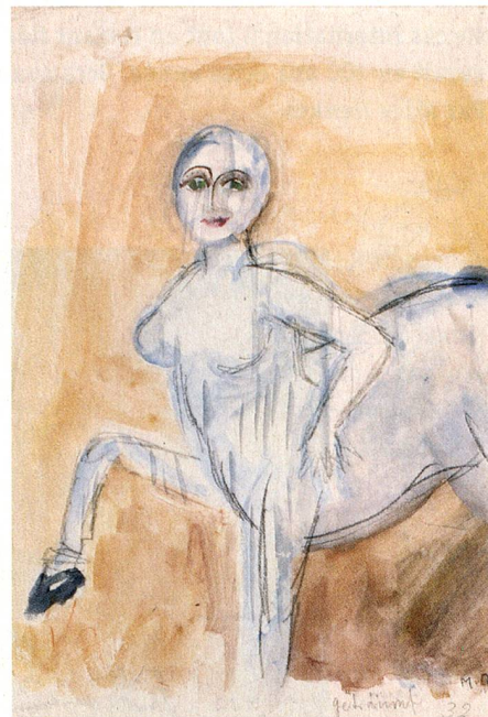
«Une centaure au fond de la mer» (1932)

comme amants des artistes célèbres comme Picasso et Max Ernst. Mais le rapide succès superficiel de la tasse en fourrure et des photos de nu brise son amour-propre et elle traverse une crise de création jusqu'en 1954. Elle travaille, mais sans satisfaction intérieure. La toile «Femme de pierre» (1938), qui représente une silhouette féminine formée de pierres, exprime de manière dramatique cette sensation de paralysie.