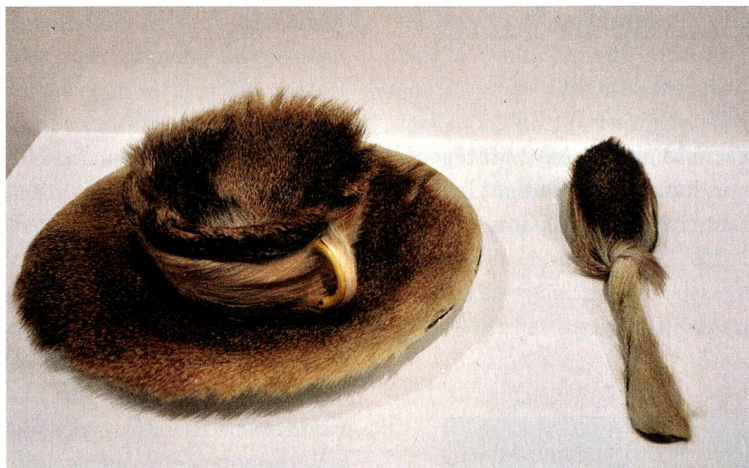
«Tasse en fourrure» (1923)