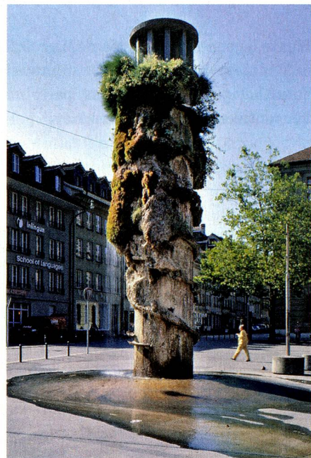
La fontaine controversée de Meret Oppenheim à Berne

Seule Berne met du temps à comprendre son œuvre tardive. Sa fontaine installée en 1983 sur la Waisenhausplatz suscite alors de violentes controverses. Si Berne ne lui rend pas la vie facile, l'artiste se montre en revanche magnanime en léguant au Musée des Beaux-Arts un tiers de son œuvre. Berne dispose ainsi du plus grand fonds d'œuvres de l'artiste, qui continue d'être exposée régulièrement même après sa mort en 1985. Des établissements renommés dans le monde entier comme le musée Guggenheim à New York, le Museum of Modern Art à Chicago, le Henje Onstad Art