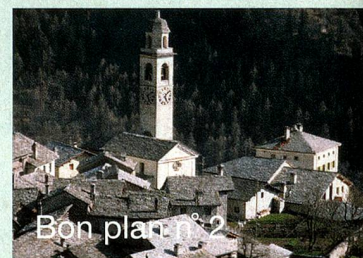
Bon plan n° 2

Le val Bregaglia dans le sud des Grisons, est un paradis pour les randonneurs et les alpinistes, mais aussi une source d'inspiration infinie pour de nombreux artistes. C'est dans cette vallée idyllique que le célèbre Alberto Giacometti a fait ses premiers pas.