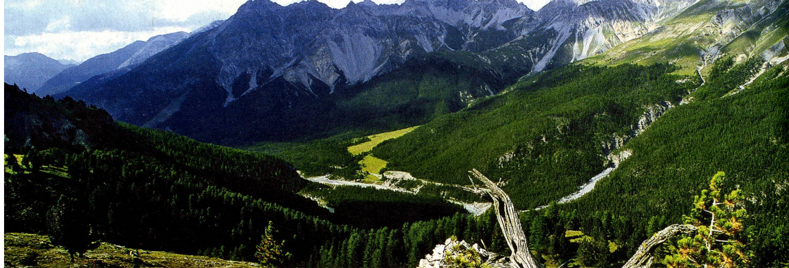
Parc National Suisse, Les Grisons