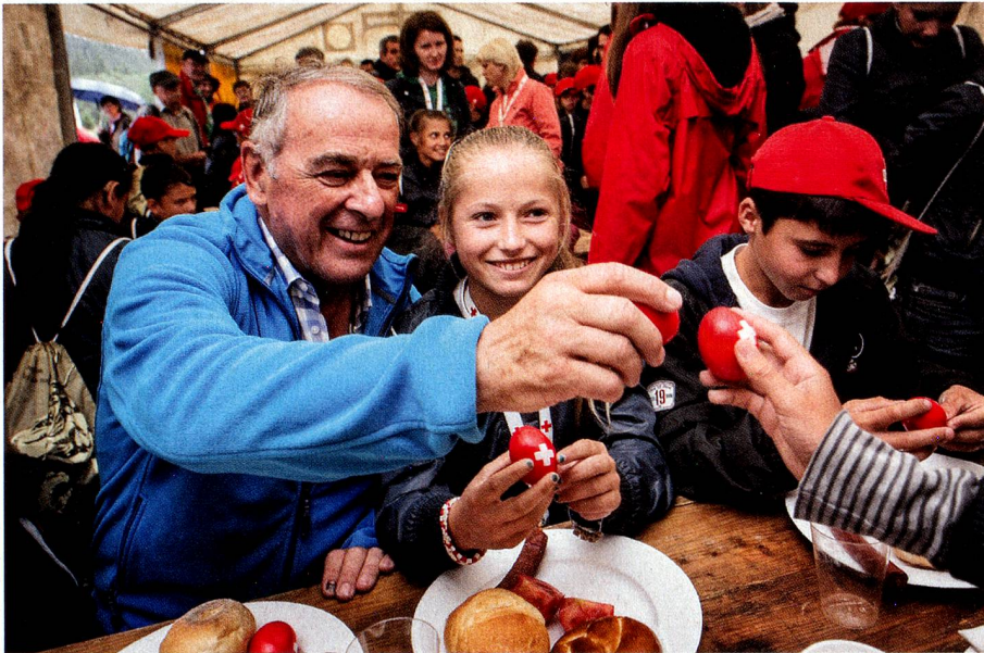
Adolf Ogi en compagnie d'enfants d'Europe de l'Est bénéficiant d'une aide médicale grâce à la fondation Swisscor

Il faut parfois observer les choses avec une distance suffisante. Comme à l'été 1992, lorsque la navette spatiale Atlantis de la NASA faisait 127 fois le tour de la Terre, avec à son bord Claude Nicollier, le premier – et jusqu'à ce jour unique – astronaute suisse. C'était une grande étape pour lui, et une étape colossale pour l'aéronautique suisse. Cette navette tournait à 30 000 km/heure autour du globe. Ce que Claude Nicollier a fait concrètement dans le cosmos glacial n'a toutefois laissé aucune trace dans la mémoire de la Suisse. En revanche, les mots qu'Adolf Ogi a criés le 7 août 1992 à l'astronaute via une liaison radio difficile: «Freude herrscht, Monsieur Nicollier!» sont, pour leur part, restés gravés. Ces félicitations (mot à mot: «La joie règne!») sont devenues aussitôt une plaisanterie. Cités des milliers de fois, ces mots sont définitivement entrés dans le vocabulaire alémanique. La joie est particulièrement grande lorsqu'elle est non seulement présente, mais se propage à tout l'environnement, et «règne».