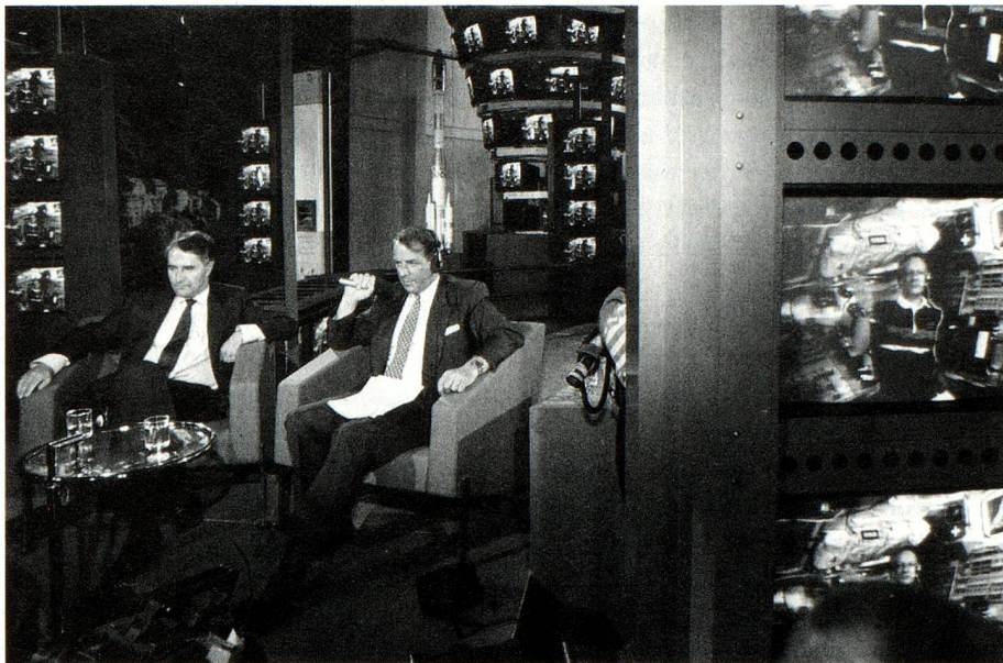
En liaison directe avec Claude Nicollier dans la navette spatiale Atlantis en août 1992

Swisscor est l'héritage social d'Ogi au Conseil fédéral. La Fondation «Freude herrscht», qu'il a également créée, allie le social au sport. Cette institution a pour but de familiariser les enfants avec le sport et la mobilité. En plaçant la jeunesse au cœur de ses projets et de son action, il essaie de s'accommoder un tant soit peu de la mort de son fils: