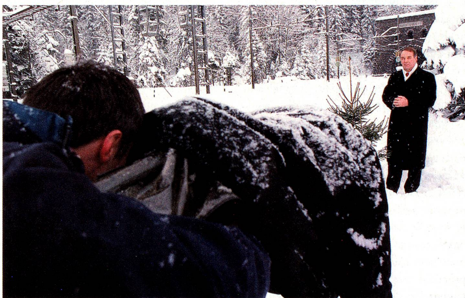
Allocution de Nouvel-An devant le tunnel du Lötschberg à Kandersteg en décembre 1999