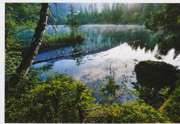
Lac de Cresta à Flims dans le canton des Grisons