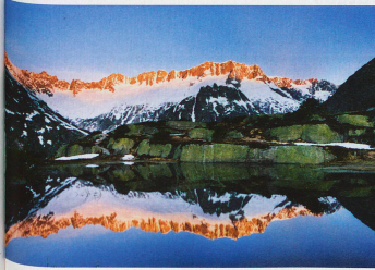
Göschernalp dans le canton d'Uri, avec les sommets de la Dammakette