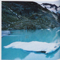
Glacier du Gault dans le canton de Berne et