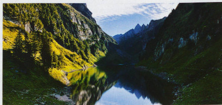
Lac de Fählen dans le canton d'Appenzell Rhodes-Intérieures avec le sommet de l'Altmann en arrière-plan