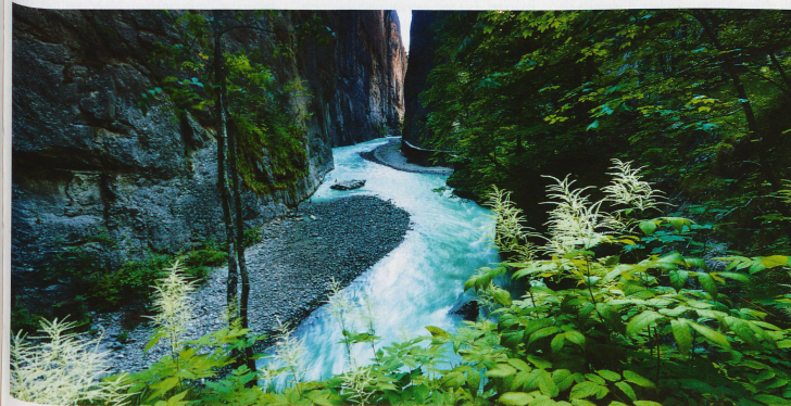
Gorges de l'Aar entre Meiringen et Innerkirchen dans le canton de Berne