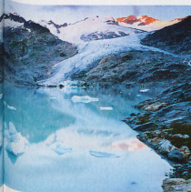
et Niglistock à l'aube en arrière-plan