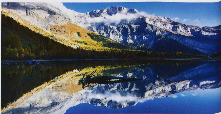
Lac de Derborence dans le canton du Valais avec l'éperon rocheux de la Tour Saint-Martin, aussi appelée Quille du Diable