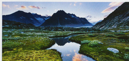
L'affluent du lac de Märjelen au bord du grand glacier d'Aletsch dans le canton du Valais.