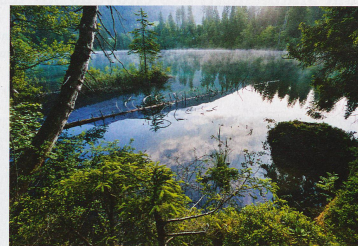
Lac de Cresta à Fims dans le canton des Grisons