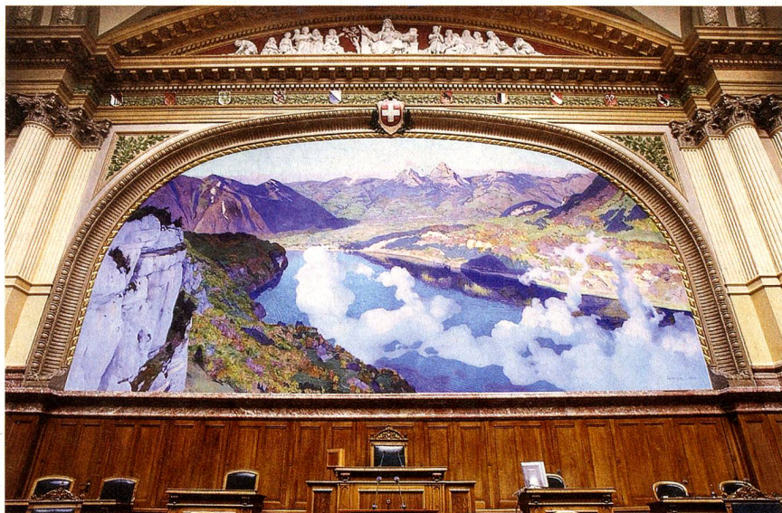
Fresque murale de Charles Giron dans la salle du Conseil national représentant le lac des Quatre-Cantons, la prairie du Grütli et les mythes en arrière-plan. Une silhouette de femme nue flotte dans les nuages, elle tient à la main une branche d'olivier en or, symbole de la paix