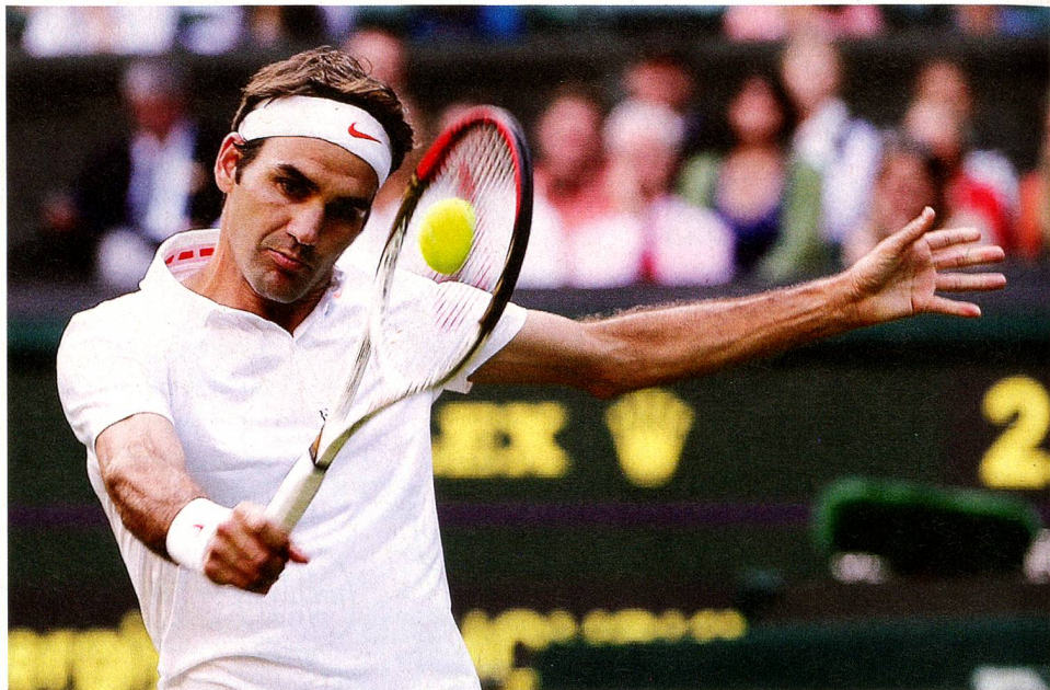
Roger Federer à Wimbledon en 2013

Dans le choix de ses sponsors, Roger Federer recherche l'équilibre qu'il incarne lui-même. Parmi ses dix équipementiers et sponsors – laissons de côté les marques internationales Rolex et Credit Suisse –, trois sont suisses: Lindt, l'assurance Nationale Suisse et le fabricant d'appareils ménagers Jura. Mais une marque de fers à repasser n'est-elle pas un partenaire un peu trop sage pour une star de l'envergure de Federer?