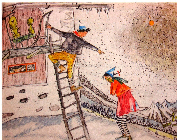
Extrait du livre «Florina et l'oisillon sauvage»