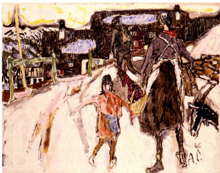
Famille de paysans à la montagne (1965), huile sur toile

Aujourd'hui, 30 ans après le décès d'Alois Carigiet (1902 – 1985) et pour le 70 e anniversaire d'«Une cloche pour Ursli», le Musée national suisse rend hommage à l'œuvre de Carigiet. L'exposition «Alois Carigiet. Art, graphisme et une cloche pour Ursli» rappelle que le peintre grison est considéré tant pour son œuvre de graphiste, scénographe et peintre que pour ses livres d'images. L'ouvrage «Alois Carigiet – Kunst, Grafik, Schellen-