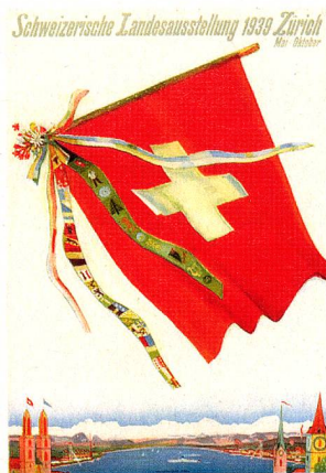
Affiche pour l'exposition Landi 39 à Zurich