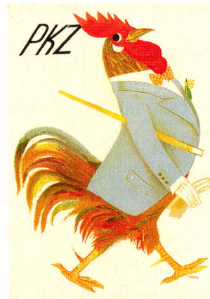
Affiche pour PKZ (1935)