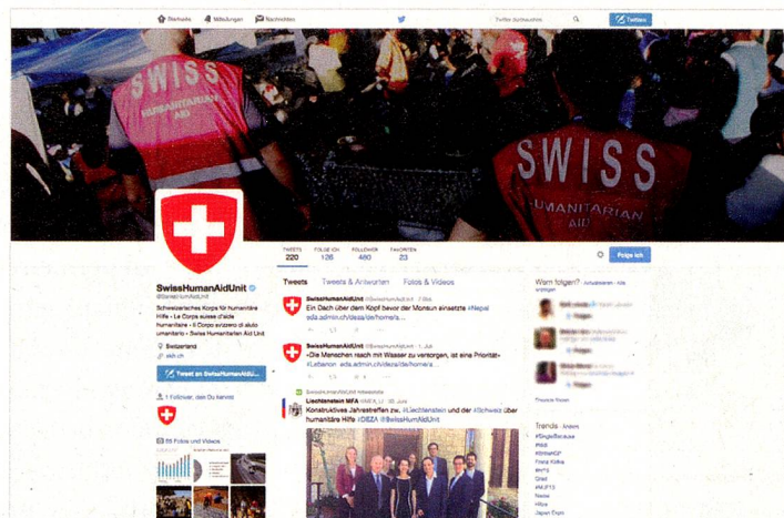
Profil Twitter du Corps suisse d'aide humanitaire.

personnalités politiques, économiques et culturelles. Leur utilisation peut se révéler cruciale dans des régions où la liberté de la presse est restreinte.