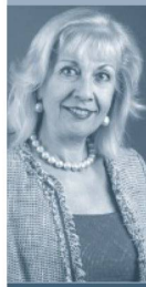
Line Marie Leon-Pernet CONSUL GÉNÉRAL DE SUISSE À STRASBOURG

Avec mes vœux les meilleurs de bonheur, santé et prospérité pour cette nouvelle année 2017