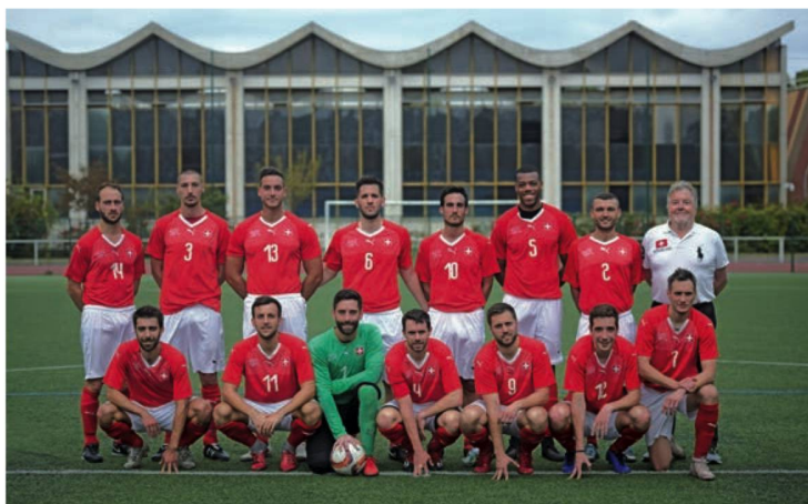
Equipe suisse au chômage technique