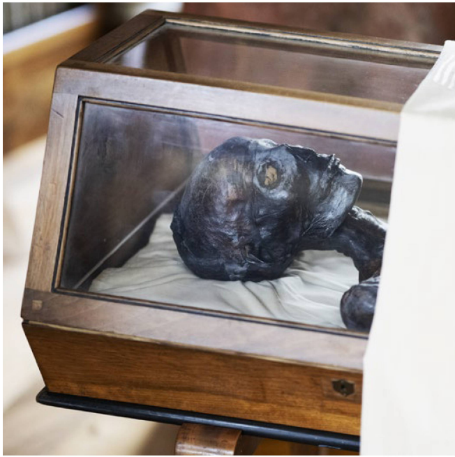
Shepenaset dans son cercueil d'exposition en verre à Saint-Gall. Chaque soir, le personnel prend congé d'elle, recouvre le cercueil d'un drap blanc et referme les portes.

étrangers, ou «recherche de provenance», la Suisse en connaît, surtout dans le contexte de l'or et de l'art volés pendant la Deuxième Guerre mondiale. En 2002, un groupe d'experts dirigés par Jean-François Bergier a soumis au Conseil fédéral un rapport détaillé montrant que le secteur économique suisse avait étroitement collaboré avec le régime national-socialiste. Des œuvres d'art vendues pendant la période nazie en Allemagne (1933-1945) se sont retrouvées dans des collections publiques et privées. Aujourd'hui, on estime qu'il est nécessaire de savoir s'il s'agit d'art confisqué par les nazis. Cet engagement moral, le Kunstmuseum de Berne –