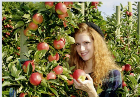
Un énorme éventail caractérise les 245 professions pour lesquelles des apprentissages sont proposés en Suisse – d'arboriculteur / arboricultrice ...

Un apprentissage professionnel dure trois ou quatre ans, selon la profession. Le di-