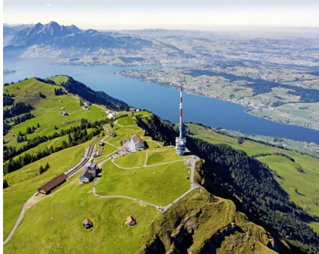
Prise de vue aérienne du Rigi avec vue sur le lac des Quatre-Cantons, le mont Pilate et le plateau lucernois.

et sera marqué par la présence d'un membre du gouvernement suisse et par la participation du monde économique et de la recherche, offrant ainsi de multiples occasions de réseautage. Les festivités comporteront des discours officiels, des animations et bien