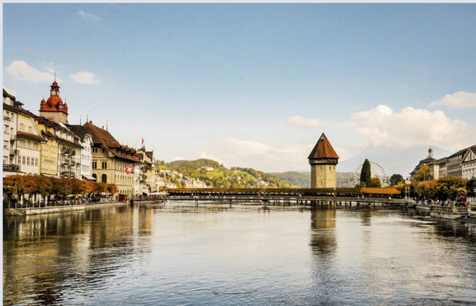
Un des symboles les plus connus de Lucerne: le pont Kapellbrücke avec le château d'eau.

La 100e édition du Congrès des Suisses de l'étranger se déroulera dans un cadre magnifique: à Lucerne, avec le lac des Quatre-Cantons et le panorama alpin en arrière-plan. Mais surtout, le congrès célébrera trois anniversaires en même temps - et promet des échanges enrichissants.