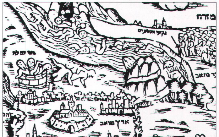
Abb. 2. Ausschnitt aus der hebräischen Holzschnittkarte (um 1560). Darstellung der wunderbaren Errettung der Israeliten an den Bächen des Arnon.

In der Mitte des oberen Bildabschnittes schildert der Holzschnitt eine Begebenheit, die nur in der rabbinischen Literatur belegt ist: die wunderbare Errettung der Israeliten an den Bächen des Arnon. Als sich nämlich Amoriter – so erzählt die Legende – in den Höhlen auf der moabitischen Seite des Baches Sered versteckten, um die herannahenden Israeliten aus dem Hinterhalt zu überfallen, bewegte sich das mit Wölbungen (ähnlich Brüsten) versehene Gebirge auf der gegenüberliegenden Seite, drang in die Höhlen ein und zermalmte die amoritischen Krieger. Die Israeliten erfuhren von diesem Wunder erst, als sie weiter in moabitisches Gebiet, nach Beer zum Brunnen zogen, aus welchem Blut und Glieder der Getöteten emporstiegen 8 (Abb. 2).