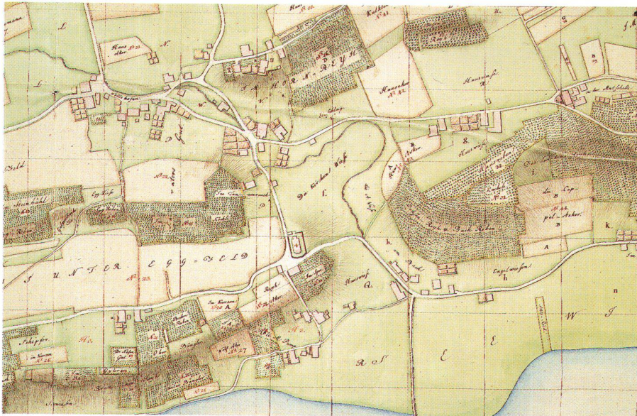
Abb. 2: Geometrischer Plan des ganzen Gemeindeflachs von Wollishofen von Johannes Feer, Ausschnitt mit Ober- und Unterdorf Wollishofen, Kirche, den Häusergruppen Rumpump, Am Bach und Haumesser (StAZ Q 349).

er das Hauptdreiecksnetz von Zürich bis zum Bodensee. Sein Zehntenplan von Wollishofen ist 142 x 85,5 cm gross und hat den gleichen Massstab ca. 1:2330, wie ihn Müller für die Nachbargemeinden verwendete. Diese grossmassstäbige Kartierung wurde offensichtlich vom Auftraggeber verlangt.