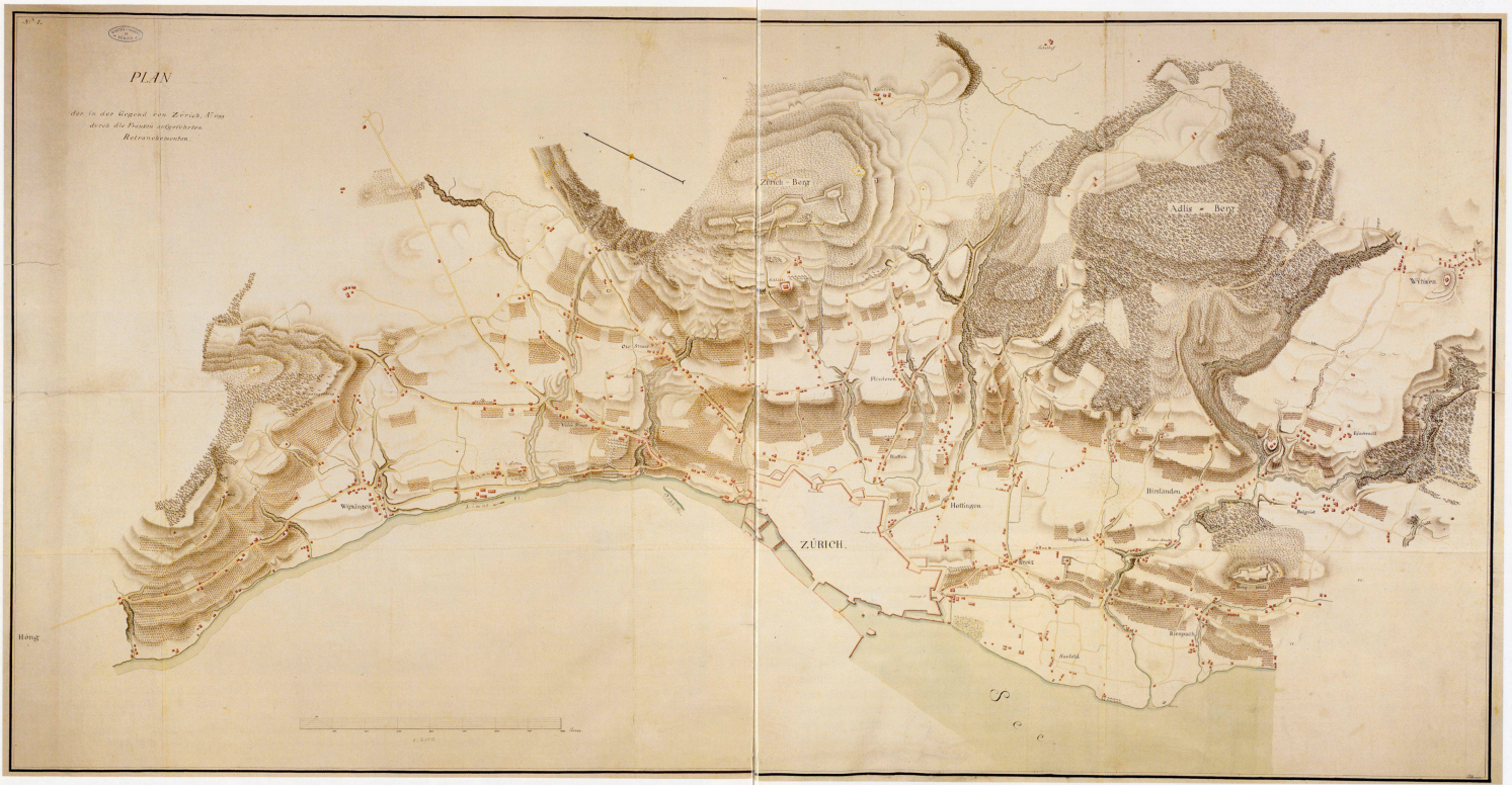
Abb. 5: Plan der in der Gegend von Zürich Anno 1799 durch die Franken aufgeführten Retranchementen von Franz Anton Messmer. Format 140 x 70 cm (ZBZ, Kartensammlung).

nicht hinlänglich Futter vor, auch wenn wir dem Militär kein Futter ausgeben müssten, wie wir leider täglich im Fall sind.