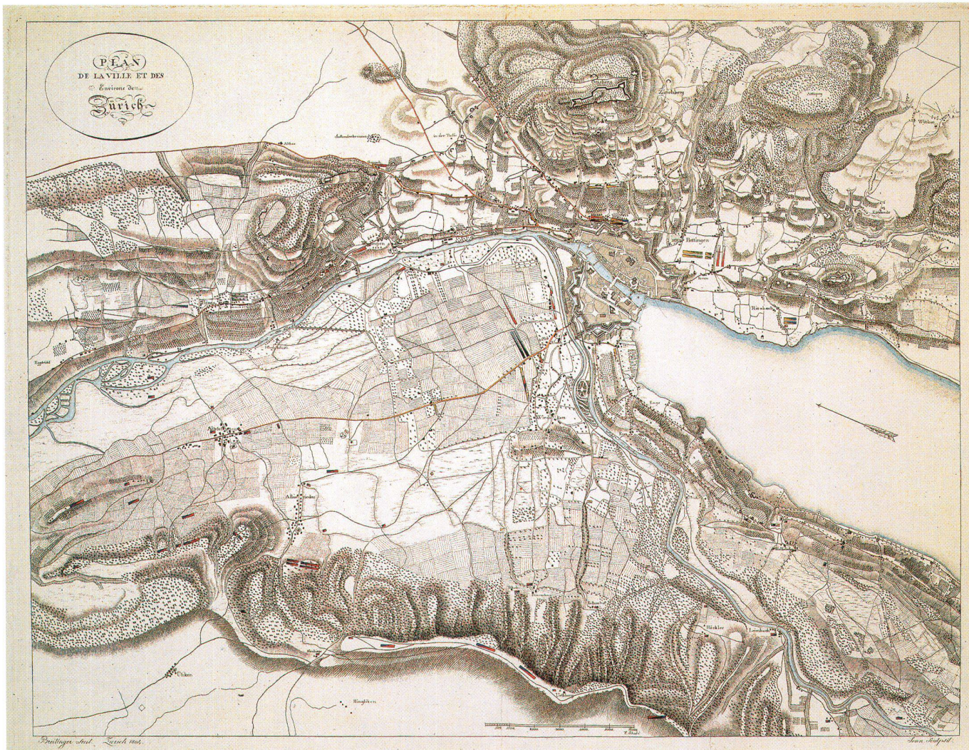
Abb. 9: Plan de la ville et des Environs de Zürich, Kupferstich von David Breiting, 1804. Format 66,2 x 51 cm (StAZ).

aufgenommen (Abb. 6). Die Handzeichnung zeigt das Gebiet rechts der Limmat von der Gemeinde Höngg bis nach Riesbach und die anschliessenden Höhenzüge. Sie misst 68,3 x 51,0 cm. Der Massstab von ca. 1 : 14 500 ermöglichte es, auch die entfernteren Orte einzuzichnen, bei denen Gefechte stattfanden oder Befestigungen angelegt waren.