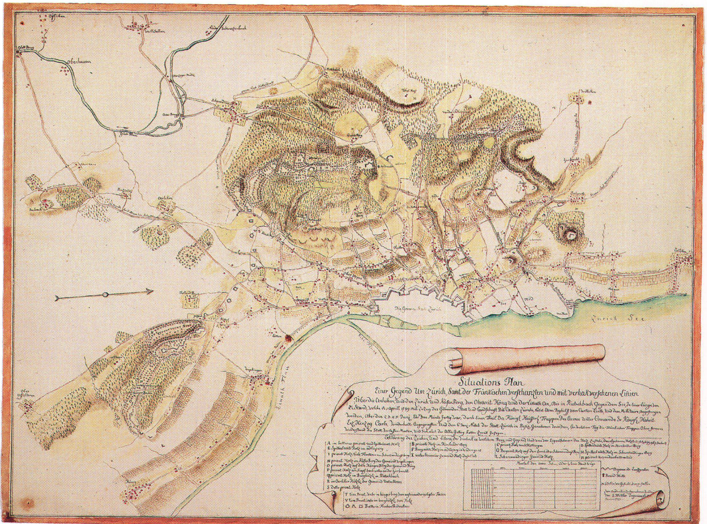
Abb. 6: Situations Plan einer Gegend um Zürich, samt der fränkischen verschanzten und mit verhakversehene Linien von Sigmund Spitteler, 1799. Format 68,3 x 51,0 cm (ZBZ, Kartensammlung).