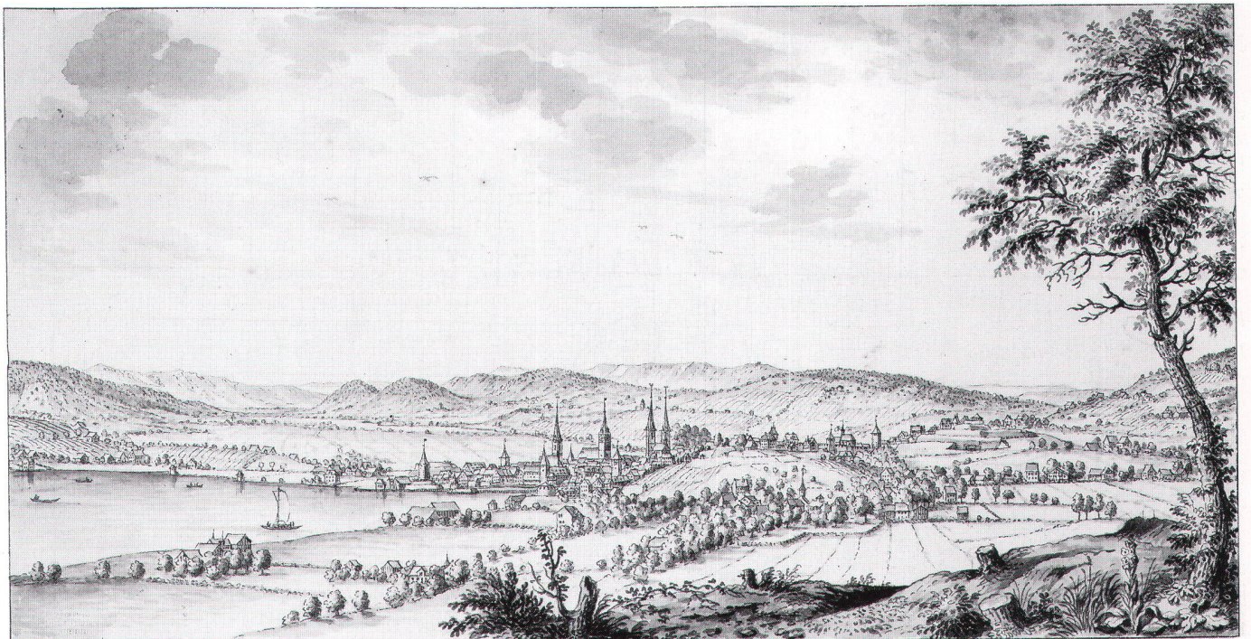
Abb. 4: Zürich von Riesbach her gezeichnet, vermutlich von Johann Melchior Füssli (1677–1736). Vorn, inmitten von Obstbäumen die erste Kirche von Riesbach am Kreuzplatz, dahinter der Hügel der Hohen Promenade. Rechts der Sattel des Milchbucks zwischen Geissberg (Zürichberg) und Hönggerberg (Chäferberg), das Einfallstor von Norden, wo die Franzosen die grossen Erdbefestigungen anlegten. Ganz

Seestrasse befinden sich in der ehemaligen Seewies, vor den Häusern Haumesser, zum Teil auf Aufschüttungen. Die Ansicht zeigt ferner Landgüter, eine Fabrik und die Ziegelei, die nach 1788 entstanden sind. Abbildung auf ca. 120% vergrössert (Zentralbibliothek Zürich [ZBZ], Kartensammlung) (vgl. Abb. 8).