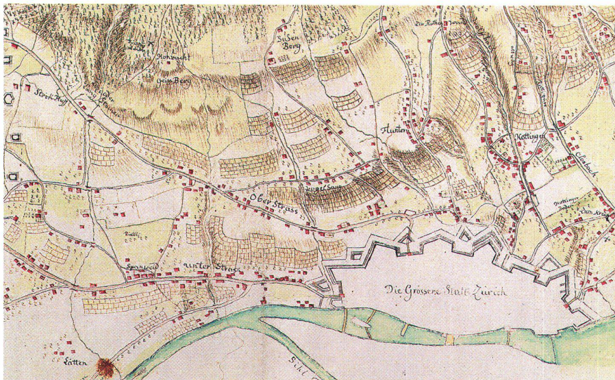
Abb. 7: Ausschnitt aus Abb. 6.

gebrechlich und wenig und nicht arbeiten können und 67, die arbeiten können, aber verdienstlos sind in Wollishofen. Die Armen sind teils aus dem Armengut, teils von Bürgern der Gemeinde, alle Sonntage die Dürftigsten, mit etwas Brot aus dem Almosenamnt unterstützt worden.