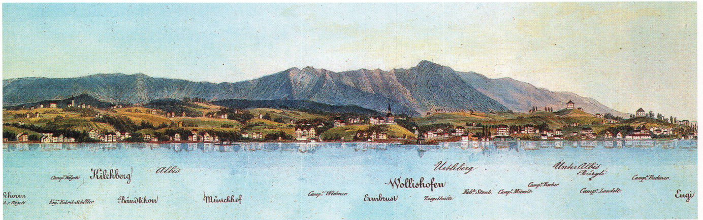
Abb. 3: Teilstück des Panoramas Ufer des Zürcher See's , 1838, von Franz Schmid (1796–1851). Ober- und Unterdorf Wollishofen liegen auf einer Verflachung hinter der Kirche, rechts der Kirche ist das Schulhaus. Unten am See standen die Häuser Erdbrust, Am Bach (heute Albisstrasse) und Haumesser. Der Bahnhof Wollishofen und die heutige

Seestrasse befinden sich in der ehemaligen Seewies, vor den Häusern Haumesser, zum Teil auf Aufschüttungen. Die Ansicht zeigt ferner Landgüter, eine Fabrik und die Ziegelei, die nach 1788 entstanden sind. Abbildung auf ca. 120% vergrössert (vgl. Abb. 8).