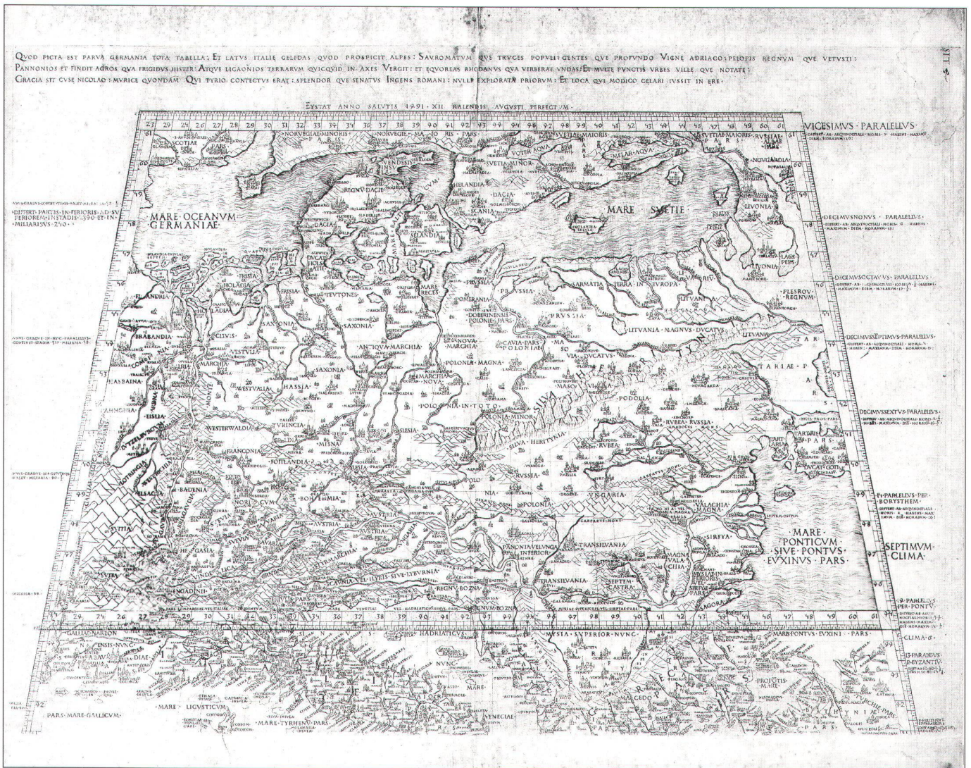
Abb. 2: Die letzte Ausgabe der «Eichstätter Karte» nach Nicolaus Cusanus, Basel 1530; siehe Kat. Nr. 16 (Germanisches Nationalmuseum, Nürnberg).

vorliegende Nennung wird zum Terminus ante quem.