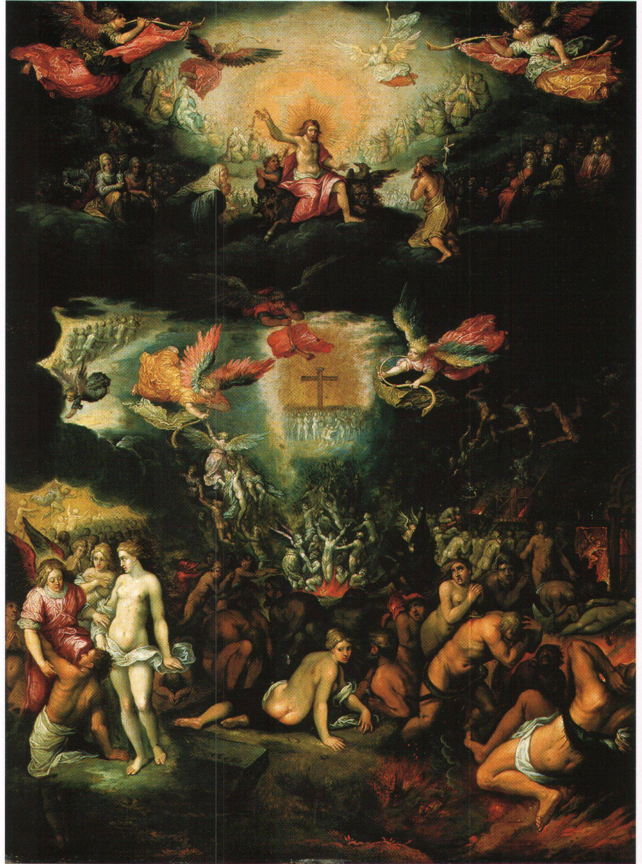
Abb. 1: Pieter Lisaert IV (?), Das Jüngste Gericht, 1608. Öl auf Kupfer, ca. 38x52 cm (Gemäldesammlung des Schottenstiftes in Wien, Inv. Nr. 25).

Die Darstellung des Weltenrichters, der die Auferstandenen in Selige und Verdammte scheidet, beruht vor allem auf dem Bericht des Matthäus-Evangeliums (24, 30–32; 25, 31–46). Christus thront, von einer Lichtaureole umgeben, auf den vier Wesen und wird von den Fürbittern Maria und Johannes flankiert. Zu seiner Rechten vollzieht sich die Auferstehung der Seligen, während zu seiner Linken Sturz und Höllenqualen der Verdammten drastisch geschildert sind. Unter dem thronenden Christus umdrängt eine Menge von Gläubigen das ebenfalls in einer Lichtaureole erscheinende Kreuz als Sinnbild der Erlösung, dem auch die Seelen im Fegefeuer entgegenstreben. Bereits in der figurenreichen Szenerie auf der Erde vollzieht sich die episodisch geschilderte Trennung in Selige und Verdammte. Exakt in der Mitte, im «Schnittpunkt» von Gut und Böse, wendet eine weibliche Rücken-