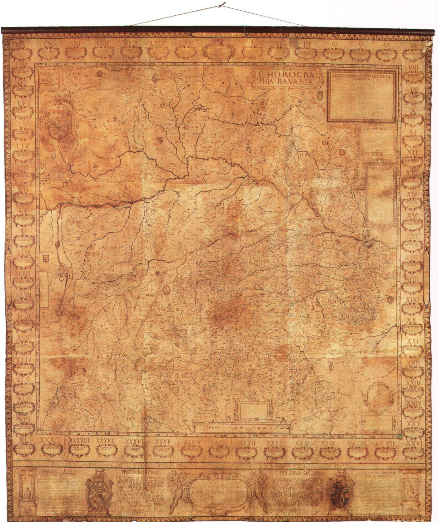
Abb. 2: Kopie der Bairischen Landtafeln Philipp Apians durch Dominicus Franciscus Calin um 1661. Handzeichnung, Format: 183 x 220 cm. Vgl. Anm. 1.

Nummer 2839 weisen auf die Aufbewahrung im Plankonservatorium des statistisch-topographischen Bureaus hin, einer Kartensammlung, der schon im Jahre 1786 das in München untergebrachte Allgemeine Plankonservatorium vorausgegangen ist. Der Kartenrand enthält ausser der Genealogie noch die Graduierung 3 und Angaben über