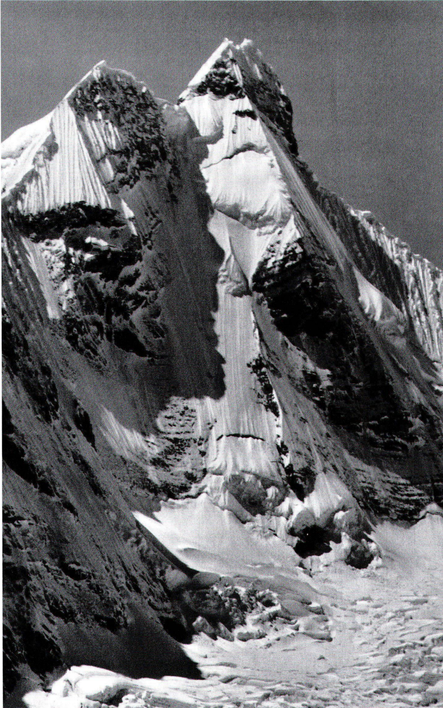
Abb. 7: Jirishanca (6126 m, Kordillere von Huayhuash), das «Matterhorn von Südamerika», 1957 von Mitgliedern des Österreichischen Alpenvereins ersterstiegen. In: Cordillera Huayhuash, Perú. Ein Bildwerk über ein tropisches Hochgebirge . Innsbruck 1955.

am 31. Mai 1970. In: Die Berg- und Gletscherstürze vom Huascarán, Cordillera Blanca, Peru . Innsbruck 1983 (= Hochgebirgsforschung , 6). S. 31–50, 13 Abb., 1 Kt.