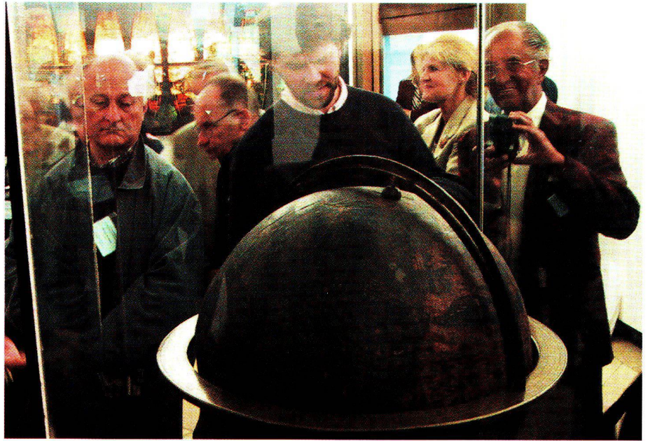
Ein Höhepunkt bildete die Besichtigung des ältesten Erdglobus von Martin Behaim (1492) im Germanischen Nationalmuseum, Nürnberg.

Nach einer Stadtführung begann am Dienstag Zsolt Török mit einem Referat über Globen des ungarischen Verlegers Kogutowicz. Im Vortrag von Johannes Dörflinger zum Thema Österreichische Schulgloben Ende 19./Anfang 20. Jhd. gab es interessante Anknüpfungspunkte zur vorhergehenden Problematik. Wolfram Pobanz brachte Licht in das Dunkel der Geschichte zum sogenannten «Führer-Globus» des Columbus Verlages. Die Dienstag-Sitzungen leitete Franz Wawrik.