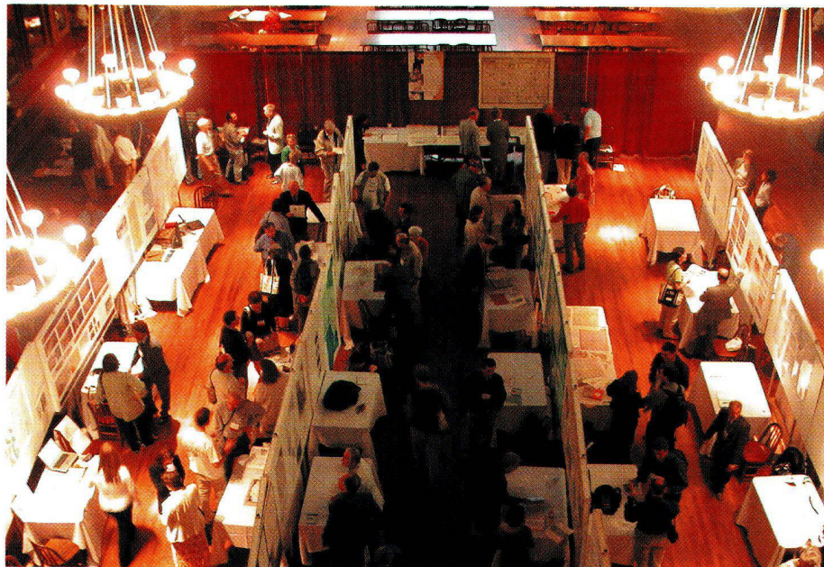
Posterausstellung in der Memorial Hall der Harvard Universität in Cambridge bei Boston.