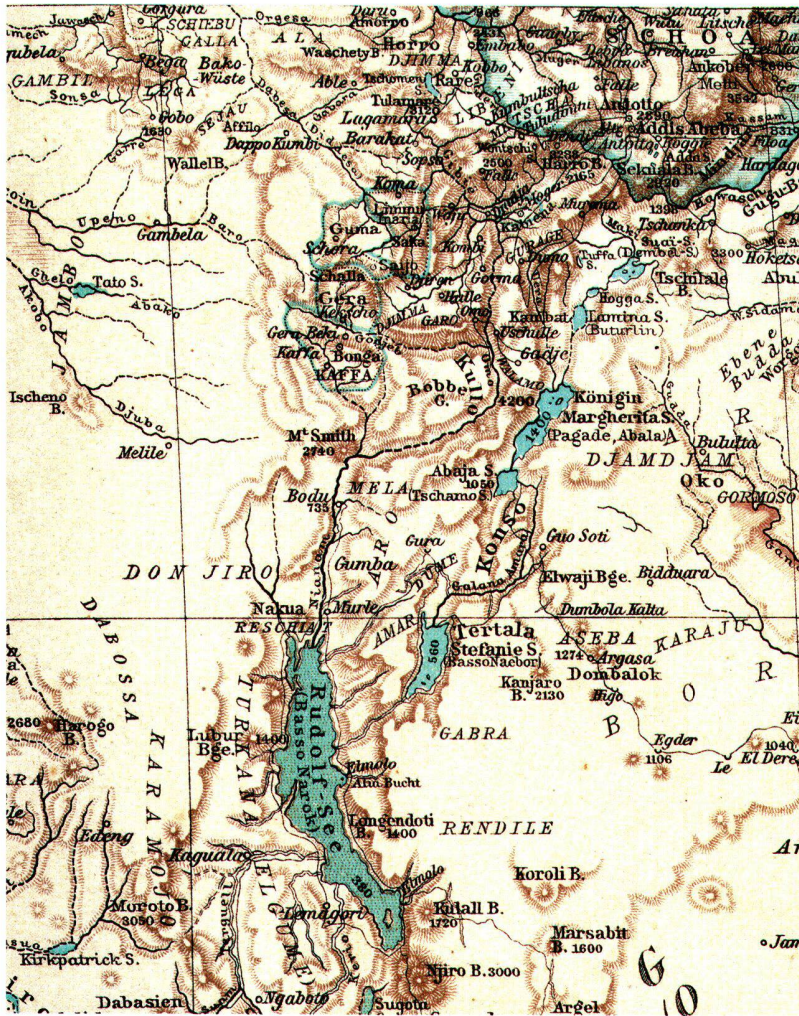
Abb. 7: Äthiopien um 1899. Ausschnitt aus der Karte Nordöstliches Afrika 1:1 Mio. (aus: Andrees Allgemeiner Handatlas, Hrsg. A. Scobel, Leipzig 1899. S. 147/148).

zum ersten Mal die Zuflüsse des Chew Bahir richtig erfasst, die auf früheren Karten falsch als Zuflüsse des Omo eingezeichnet wurden, der zum Einzugsgebiet des Lake Turkana gehört. Er hat auch gezeigt, dass die Seebecken des Lake Abaya und des Lake Chamo durch einen schmalen Wasserlauf miteinander verbunden sind. Mit seiner Karte hat Mirko Seljan die damaligen Kenntnisse der hydrographischen Verhältnisse des südlichen Äthiopiens vollkommen erneuert (vergleiche dazu die aus den aktuellsten Daten des ETHIO-GIS erstellte Äthiopienkarte [Abb. 6]: Heute ist der Stefanie-See völlig ausgetrocknet).