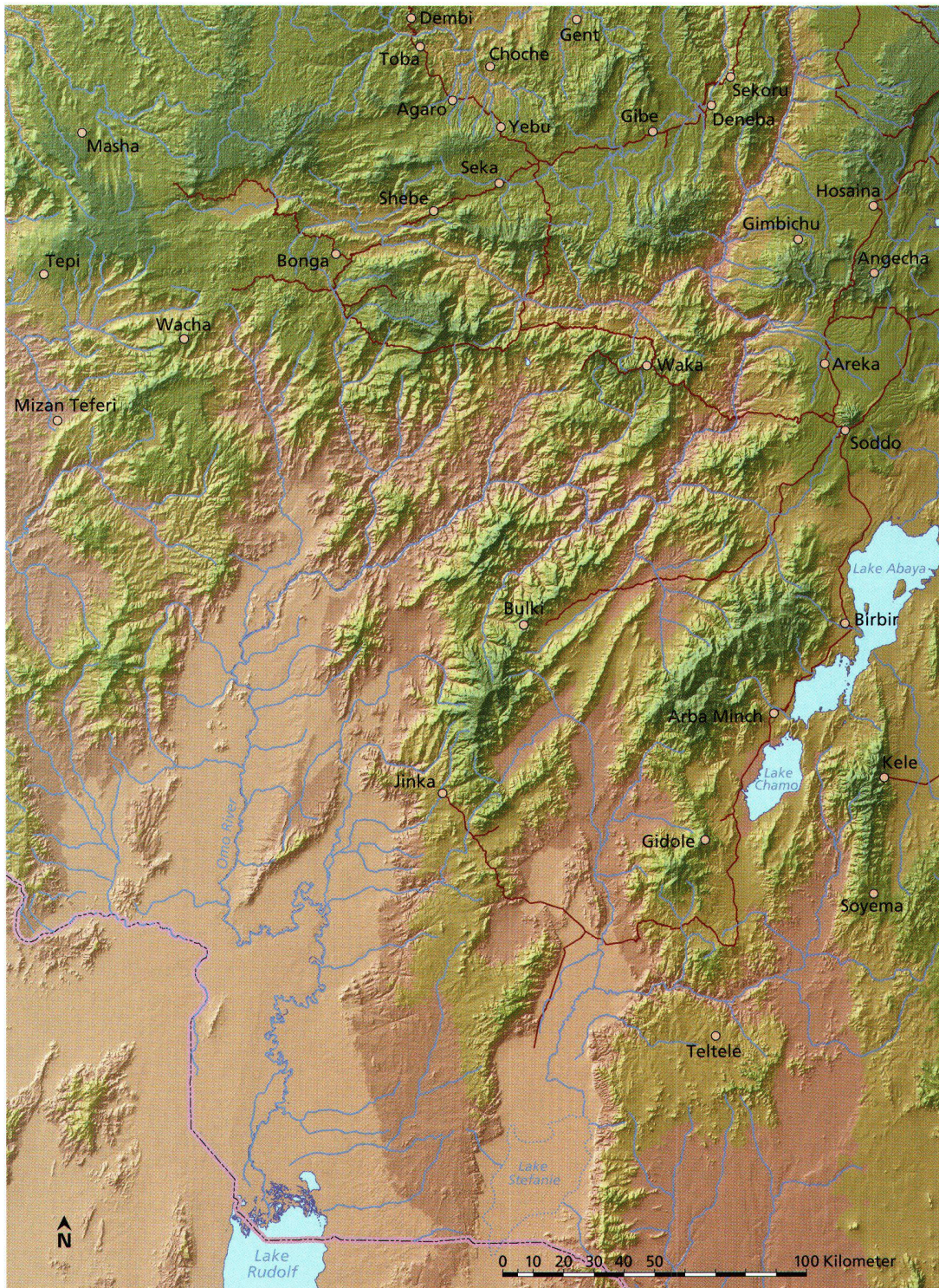
Abb. 6: Aktueller Kartenausschnitt aus ETHIO-GIS (Bearbeiter: Christoph Hösli, Geo-processing Unit, Centre for Development and Environment CDE, Geographisches Institut, Universität Bern). Man beachte: der Stefanie-See ist ausgetrocknet.