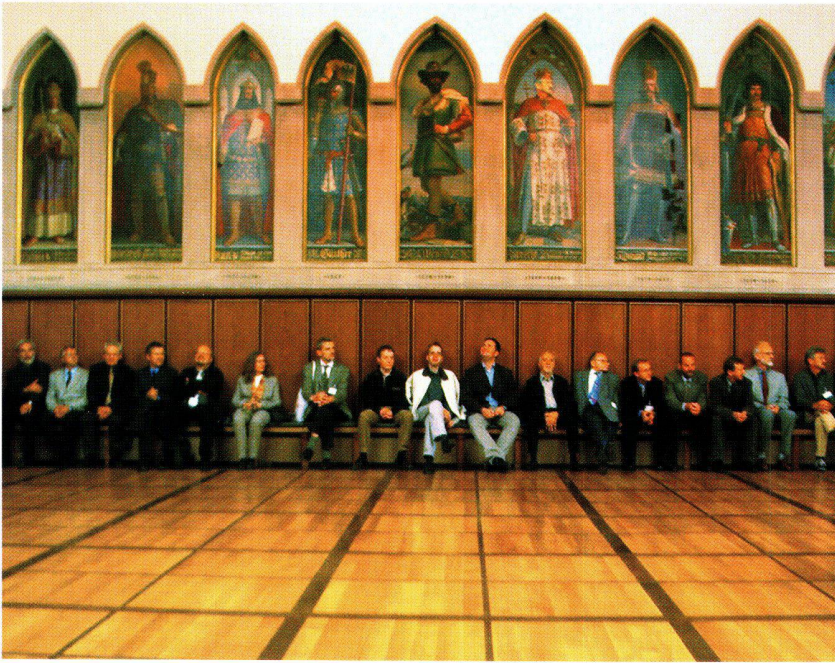
Empfang im historischen Kaisersaal zum Römer in Frankfurt am Main