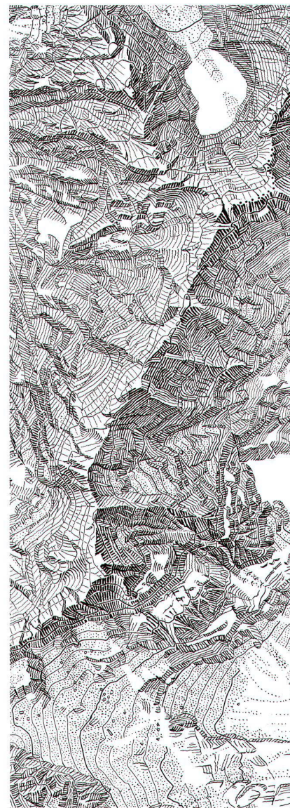
Die Engelhörner: Kopie des von Alfred Oberli erstellten Felsoriginals für die Landeskarte 1:25 000, Blatt 1230 Guttannen (Schichtgravur auf Glas). Abbildung auf 150% vergrößert.