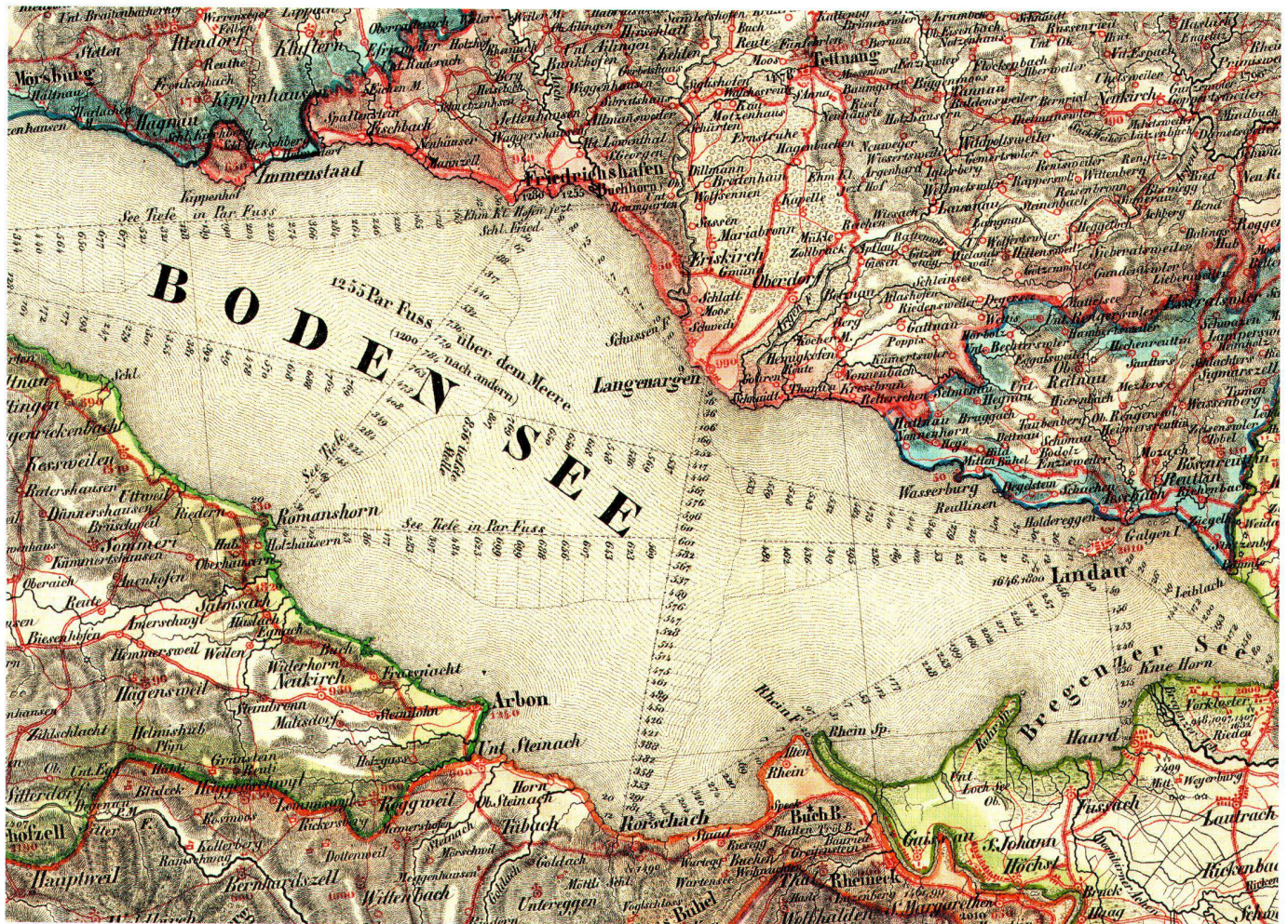
Abb. 5: Ausschnitt aus dem Blatt Constanz-Lindau. Zwischen grösseren Uferorten wurden auf insgesamt 10 Strecken in regelmässigen Abständen die Seetiefe (in Par[iser] Fuss) angegeben. Das Grenzkolorit ist von Hand gemalt. Die Beschriftung ist parallel zu den Koordinatenlinien und nicht zum Kartenrand platziert.

dass er damals im Grunde noch keine immer auf dem neuesten Stand nachgeführte Karte erwartete. Vielmehr scheint er als selbstverständlich angenommen zu haben, dass einige Teile der Karte genauer zuträfen als andere, dass also eine Unsicherheit blieb, die sich erst an Ort und Stelle ausräumen liess. Diese Unsicherheit betraf drei Ebenen: Erstens waren die politische Landschaft und damit die gezeigten Grenzen höchst ungewiss. Dass die Grenzen trotz der Möglichkeit des Farbdruckes auf der Karte immer noch handkoloriert sind, lässt sich als Folge dieser Unsicherheit, respektive als offen gelassene Option interpretieren, diese nachträglich noch verändert darzustellen. Zweitens erfuhr das Strassennetz zum Zeitpunkt des Erscheinens der Karte seine bis zum Autobahnbau grösste Umgestaltung. Und drittens erreichte die Genauigkeit der Kartenaufnahmen, auf die man sich stützte, allgemein noch nicht jene Lagetreue der Linienführungen, die einige Jahre später die Dufourkarte bieten sollte. Die Lage der Verkehrswege war auf der Schweizerkarte von Woerl im Wesentlichen noch in den Bezügen zu den Siedlungen, den Gewässerläufen, den Brücken und den markanten Landschaftselementen zu deuten, was der damals üblichen Art des Kartenlesens entsprach.