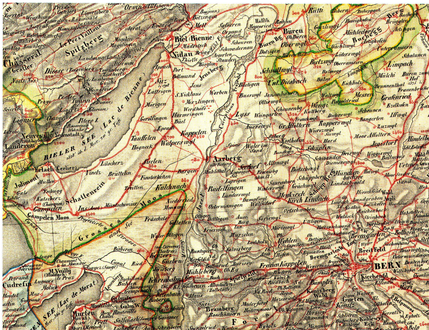
Abb. 3: Ausschnitt aus dem Blatt Bern: Die Orte und die Strassen sind rot dargestellt. Nach Bern hin führten verschiedene Strassen 1. und 2. Klasse und auch einige Verbindungswege. Eine grosse Zahl von Orts-, Flur- und Gebäudenamen sollten den Reisenden die genauere Identifikation des Standpunkts vor Ort zusätzlich erleichtern. Bei den Ortschaften ist weiter die Zahl der Bewohner und die Höhe über Meer in Fuss verzeichnet. Hier bestehen die grössten Abweichungen von der Realität. Im Grossen Moos ist die kommende Juragewässerkorrektur angedeutet (Corrections Project, Projectirte Strasse).