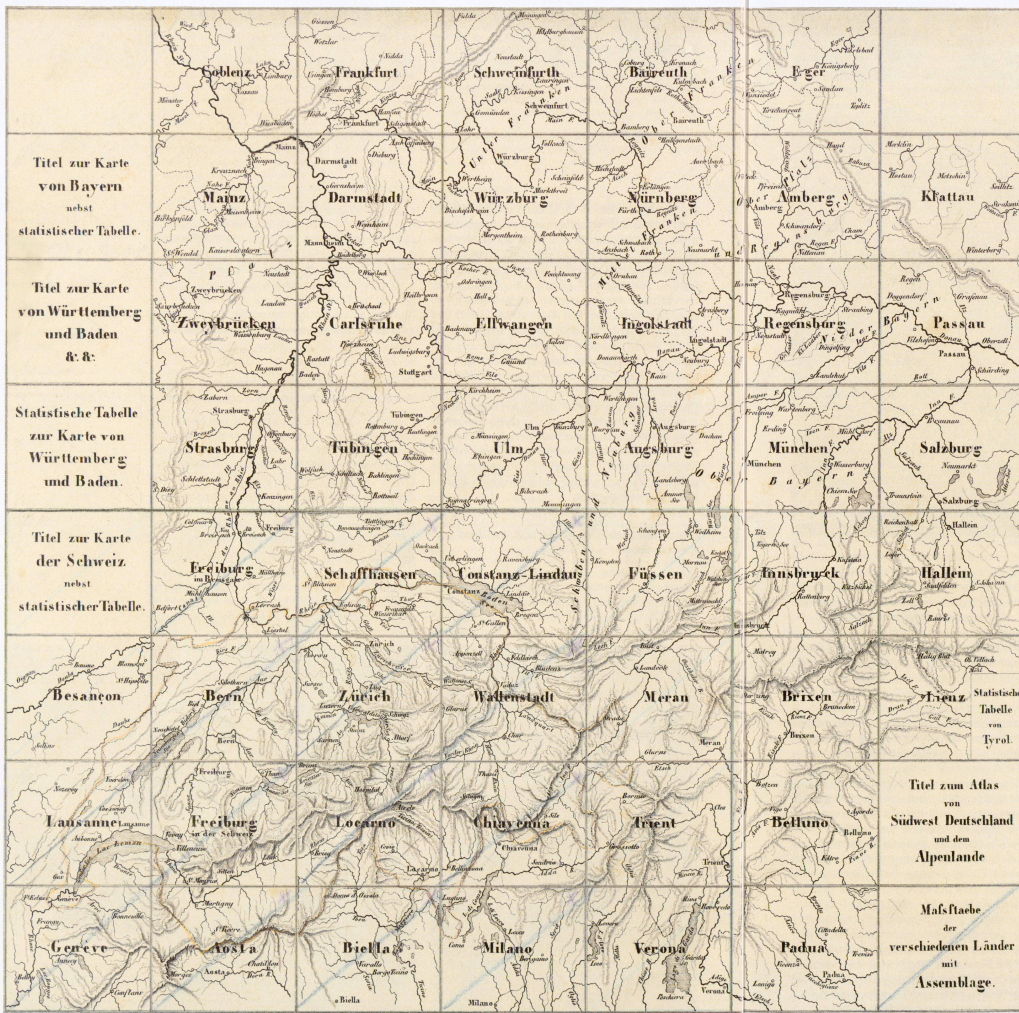
Abb. 2: Blattübersicht zur Karte von Südwest-Deutschland u. dem Alpenlande, darin integriert die 19 Blätter und das Titelblatt der Karte der Schweiz. Ausschnitt aus dem Titelblatt, verkleinert auf 95%.

war die Publikation der Schweizerkarte frühestens Ende 1835 abgeschlossen. 5 Das Neuerscheinungszeichen der Buchhandlung Hinrichs in Leipzig zeigte das Erscheinen der vierten bis zehnten Lieferung jedoch erst für 1836 an. 6 Eine Überprüfung der 19 Kartenblätter bestätigt als ungefähren Zeitpunkt der Aktualität des gezeigten Strassennetzes das Jahr 1830. Dies stimmt mit der Verlagsankündigung überein, die das Publikum 1835 darüber informierte, dass mehr als zwölf Jahre an der Karte gearbeitet worden sei. Während die meisten Strassenneu- und die grossen Strassenausbauten der 1820er Jahre, beispielsweise die zwischen 1820 und 1830 gebaute Fahrstrasse über den Gotthard oder die von 1828 bis 1829 gebaute Strasse von Zug nach Arth, in der Karte erscheinen, fand die grosse Welle des Kunststrassenbaus der 1830er und 1840er Jahre keinen Niederschlag im Kartenwerk. Der dadurch mögliche Blick in die Zeit vor diesem grundlegenden Wandel des Strassennetzes erweist sich für die verkehrsgeschichtliche Forschung als Glücksfall.