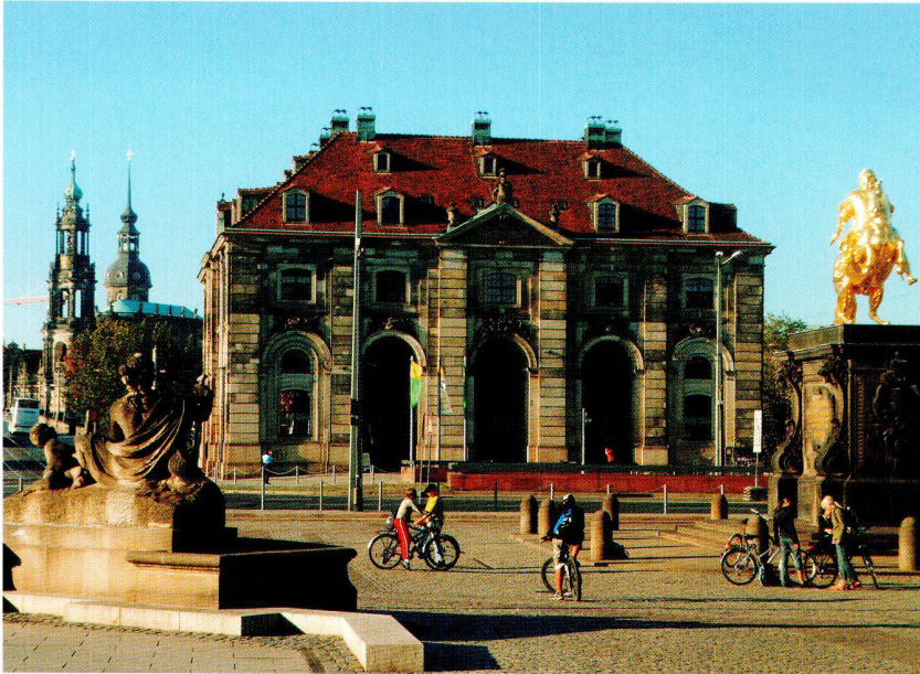
Das 13. Kartographiehistorische Colloquium fand im sogenannten Blockhaus, der ehemaligen Neustädter Wache in Dresden statt.